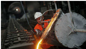
10/07/2015 Lavoro, a maggio 185 mila nuovi contratti