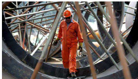
15/05/2014 ANSA Dai contratti a termine alla maternità Ecco come cambia il mondo del lavoro