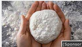
09/12/2015 (Sponsor) Pensionline. La pensione integrativa online di Genertellife.