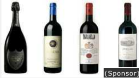
09/12/2015 (Sponsor) Migliori Vini Online -30%. Ti regaliamo 10€ per provarli!