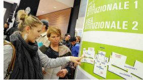
10/09/2015 ANSA Boom di contratti a tempo indeterminato