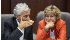
10/06/2015 LAPRESSE In 4 mesi 155 mila assunti a tempo indeterminato