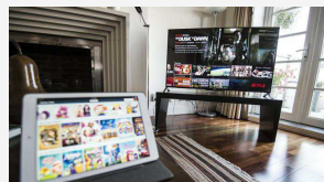
09/12/2015 Svolta Ue per smartphone e tablet. Film e sport saranno senza frontiere MARCO ZATTERIN