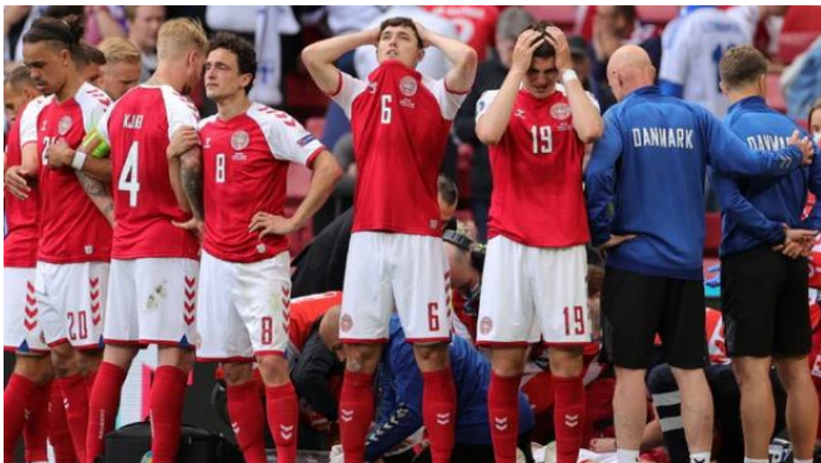
I compagni fanno barriera attorno a Eriksen

Il malore in campo dal calciatore danese Eriksen , fortunatamente risolto bene, ha tenuto tutti con il fiato sospeso ed ha commosso il mondo per il comportamento tenuto dai suoi compagni, capitano Kjaer in testa, sia nell'imminenza dell'incidente che nei minuti successivi al dramma. Il capitano ha da subito soccorso prontamente il proprio compagno , evitando che deglutisse la propria lingua e mettendolo in una posizione prona di sicurezza, ancor prima che giungessero i soccorsi, pure tempestivi. Ma anche gli altri compagni non sono stati da meno visto che con analogo spirito sono subito accorsi e, dopo uno sguardo di intesa, si sono poi posti, abbracciati, a protezione della privacy del compagno, sottraendolo allo sguardo delle telecamere: abbastanza vicini per essere solidali con il proprio compagno ma non tanto da intralciare i soccorsi.