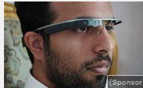
26/04/2017 L'inglese per i pigri. Con questo dopo 2 ore parla l'inglese come un madrelingua...