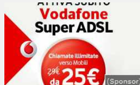
26/04/2017 Vodafone Super ADSL. Super ADSL da 25€, chiamate illimitate verso Mobili incluse...