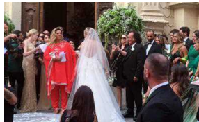
04/09/2016 Albano e Romina insieme alle nozze della figlia con il milionario croato