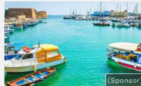
26/04/2017 Voli Malpensa Heraklion. Accedi alle offerte Meridiana e prenota ora la tua vaca...