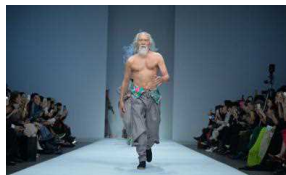
07/11/2016 Nonno 80enne esordisce da modello, la sua passerella è un vero successo