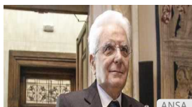
Mattarella: "Il Parlamento approvi con urgenza la riforma sulla legge elettorale"