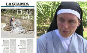
26/08/2016 Parla la suora della foto simbolo: "Ho scritto sms per dire addio agli amici"