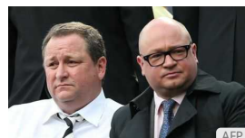
Calcio inglese nella bufera: maxi perquisizioni e arresti, in manette n.1 del Newcastle