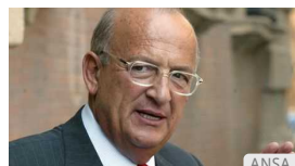
È morto Guazzaloca, macellaio colto che entrò nella storia espugnando Bologna la "rossa"