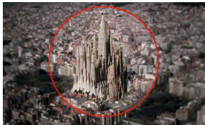
20/09/2016 Ecco come sarà la Sagrada Família al termine dei lavori nel 2026