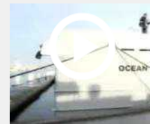
Entra in azione 'Ocean Warrior', nuovo pattugliatore contro le baleniere giapponesi