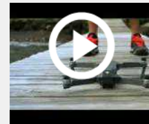
Mavic Pro, arriva il drone pieghevole