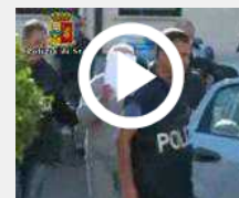
Matera, Polizia sgomina banda di ladri di autovetture