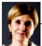
di RITA BARTOLOMEI

Se una piccola azienda su tre assumesse un ragazzo, non avremmo più disoccupazione giovanile. Ma oggi mancano le condizioni