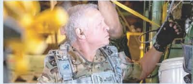
Aiuti dal cielo. Il re giordano Abdullah II durante l'operazione di soccorso a Gaza