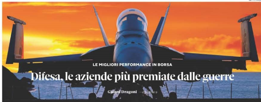
Profitti bellici. Nel 2023 la spesa militare mondiale è aumentata per il nono anno consecutivo, gli ordini per i produttori crescono a livelli record e sui listini i titoli volano