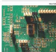
Momento d'oro. Un chip a Taiwan