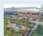
Dall'alto. Il nuovo mall

REAL ESTATE Merlata Bloom, apre a Milano il centro commerciale da 400 milioni