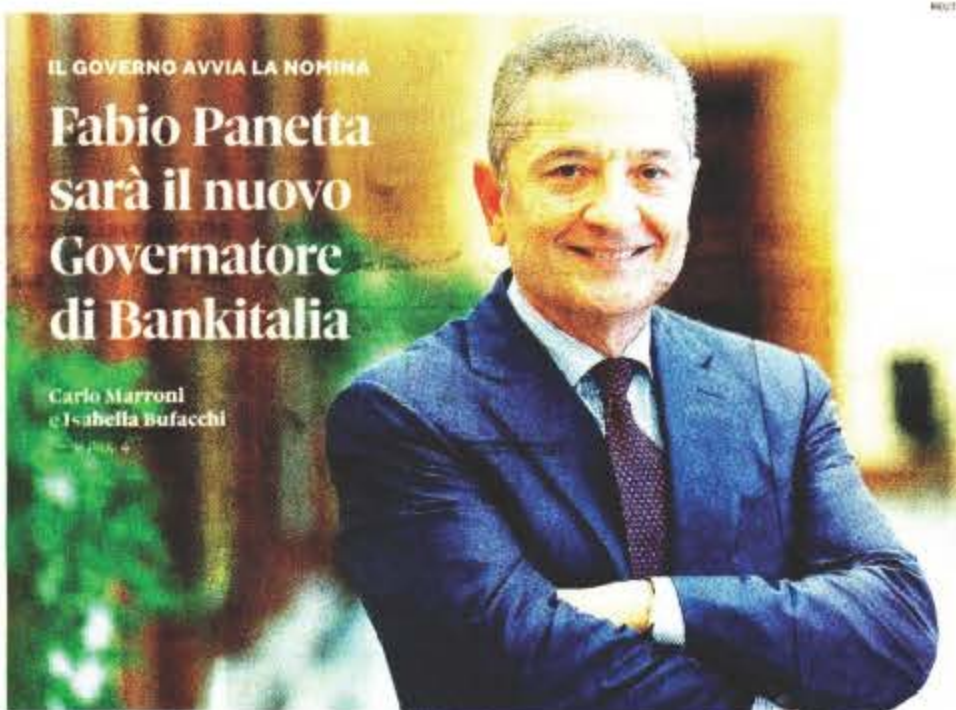
Al top. Fabio Panetta, già presidente Ivass e membro del comitato esecutivo Bce, è il nuovo Governatore di Bankitalia