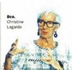
Bce, Christine Lagarde